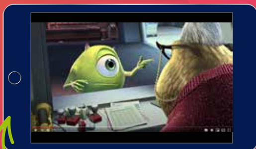
MONSTROS S.A. 3D: TRAILER OFICIAL youtube.com/watch?v=iRh2kF-1X2E