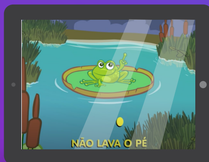
O sapo não lava o pé - DVD Galinha Pintadinha