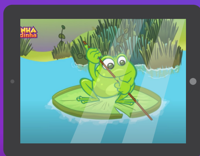
Sapo cururu - Clipe Música Oficial - Galinha Pintadinha DVD 2